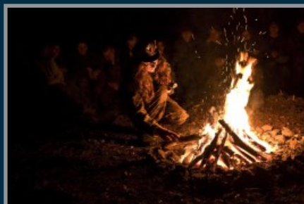
Długie wieczory przy ognisku