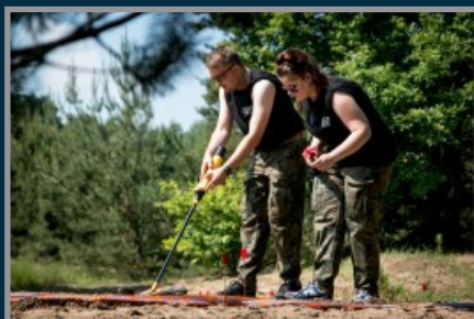
Ciekawe (niebanalne) zadania

Czego możesz się spodziewać na Harcerskim Rajdzie Radziejewskim?